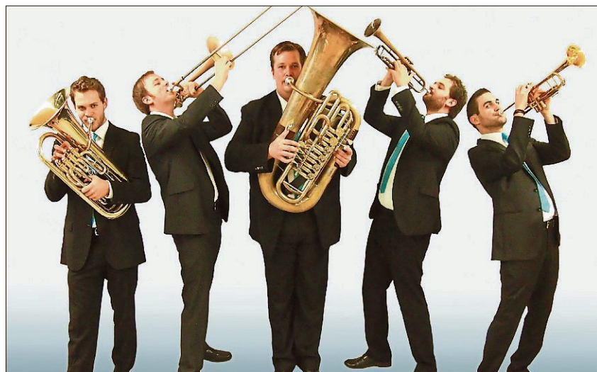
Am dritten Advent spielt das Bläserquintett „Ostbayern Brass“.

weihnachtszeit ein Anliegen, schöne und besinnliche Blechbläserklänge in die Kirchen der Städte und Dörfer des Landkreises zu tragen. Mal schwungvoll, mal traumhaft harmonisch interpretieren sie Werke von Bach, Händel, Mendelsohn, unter anderen sowie eigene Arrangements. Das Konzert beginnt um 16 Uhr. Der Eintritt ist frei, Spenden kommen einer sozialen Einrichtung zugute.