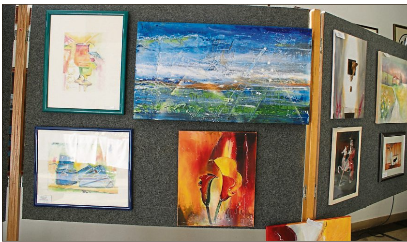
Auf viele schöne Kunstwerke von Christa Strasser darf man sich in der Ausstellung am Pfaffenger Christkindlmarkt freuen.