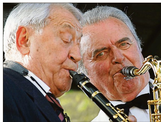
Max Greger senior und Hugo Strasser begeistern das Publikum mit ihren gefühlvollen Melodien.